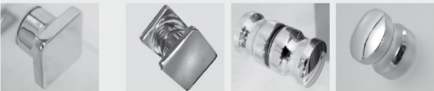
ZB 8559 ZB 4062 ZB 08 ZB 4035

STANDARDGREB: Udvalg: Ved fornyet bestilling af en brusevæg uden ekstrapris