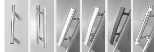
ZB 182 ZB 183 ZB 4137 ZB 4163C ZB 4163B ZB 4150

Stanggreb: Valgfri mod merpris i særlig størrelse